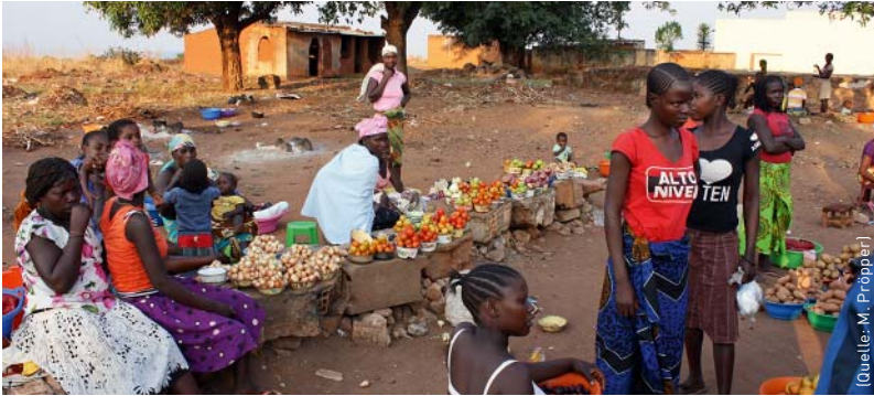
Lokaler Markt in der Nähe von Chitembo, Angola.

wissenschaftlicher Expertise. »Ziel ist, Instrumente und Szenarien zu liefern, wie Menschen in der Region mit unterschiedlichen Interessen die Vielzahl von Ressourcen dauerhaft nutzen und erhalten können«, sagt er.