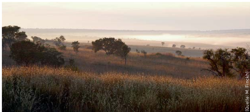
Blick ins Tal in der Nähe von Chitembo, Angola.