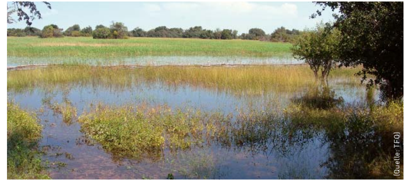
Okavanga Delta, Botswana.

Damit der Streit ums Wasser nicht wie in einigen anderen Regionen der Erde zu einem gefährlichen Konflikt wird, haben die drei Anrainer-Staaten vor-