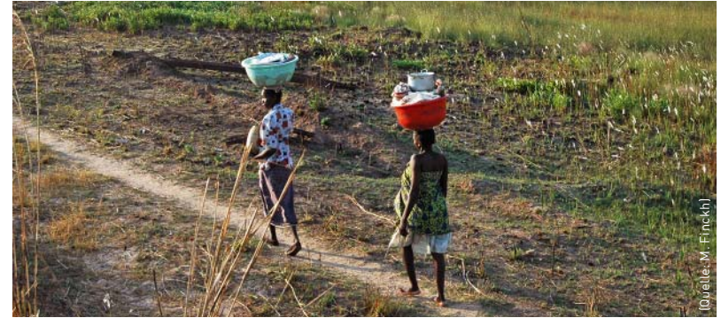
Arbeitsalltag der Frauen in Cussequ, Angola.

Von den Erträgen, die die Landwirtschaft abwirft, sind die meisten Menschen entlang des Okavangos