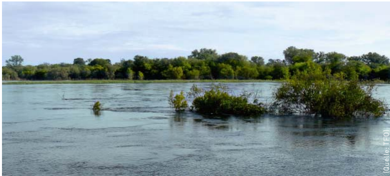
Der Okavango, Namibia.