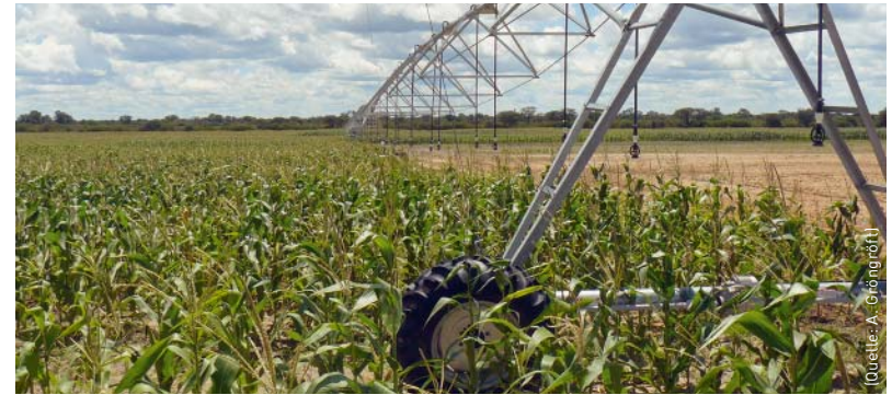
Kommerzielle Bewässerungslandschaft in Namibia.