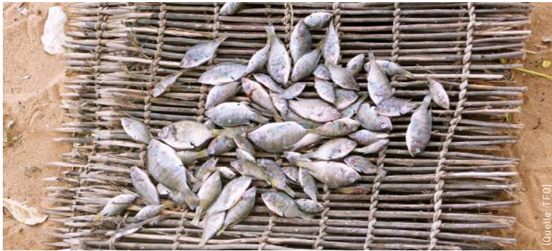
Ausbeute eines Fischfangs mit traditionellem Fanggerät, Namibia.