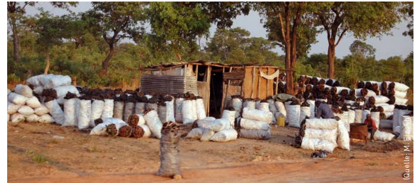
Holzkohlehandel entlang einer Straße, Angola.

die Natur ihnen anbietet: Sie fangen Fische, bauen Getreide an, sammeln Faserstoffe, Brenn- und Baumaterialien und nutzen Arzneipflanzen. Und das im Rhythmus der Natur. 500 Vogel-, 128 Säugetier- sowie 150 Reptilien- und Amphibienarten zählten Forscher allein im Flussdelta in Botswana. Lange Zeit war das Gleichgewicht intakt, jetzt droht es