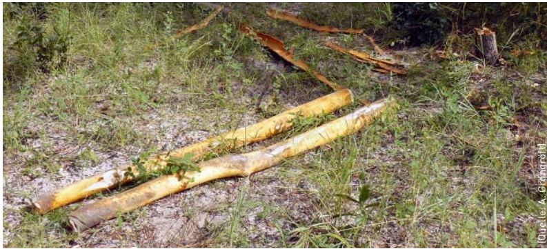
Illegal gefälltes Holz als Baumaterial, Namibia.

nicht wie sonst üblich auf der gesamten Fläche verteilt, sondern in aufwändiger Arbeit einzeln in kleine vorgebohrte Löcher gesät, die dann mit Kuhmist gedüngt und mit Kompost zugedeckt werden.